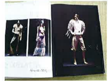
(上写真)現在、発注しております