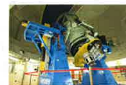
公開用望遠鏡「那由多」